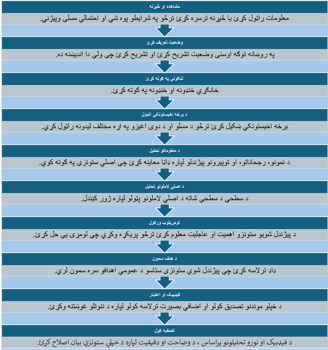
شکل 2: د ستونزې پیژندلو پروسه