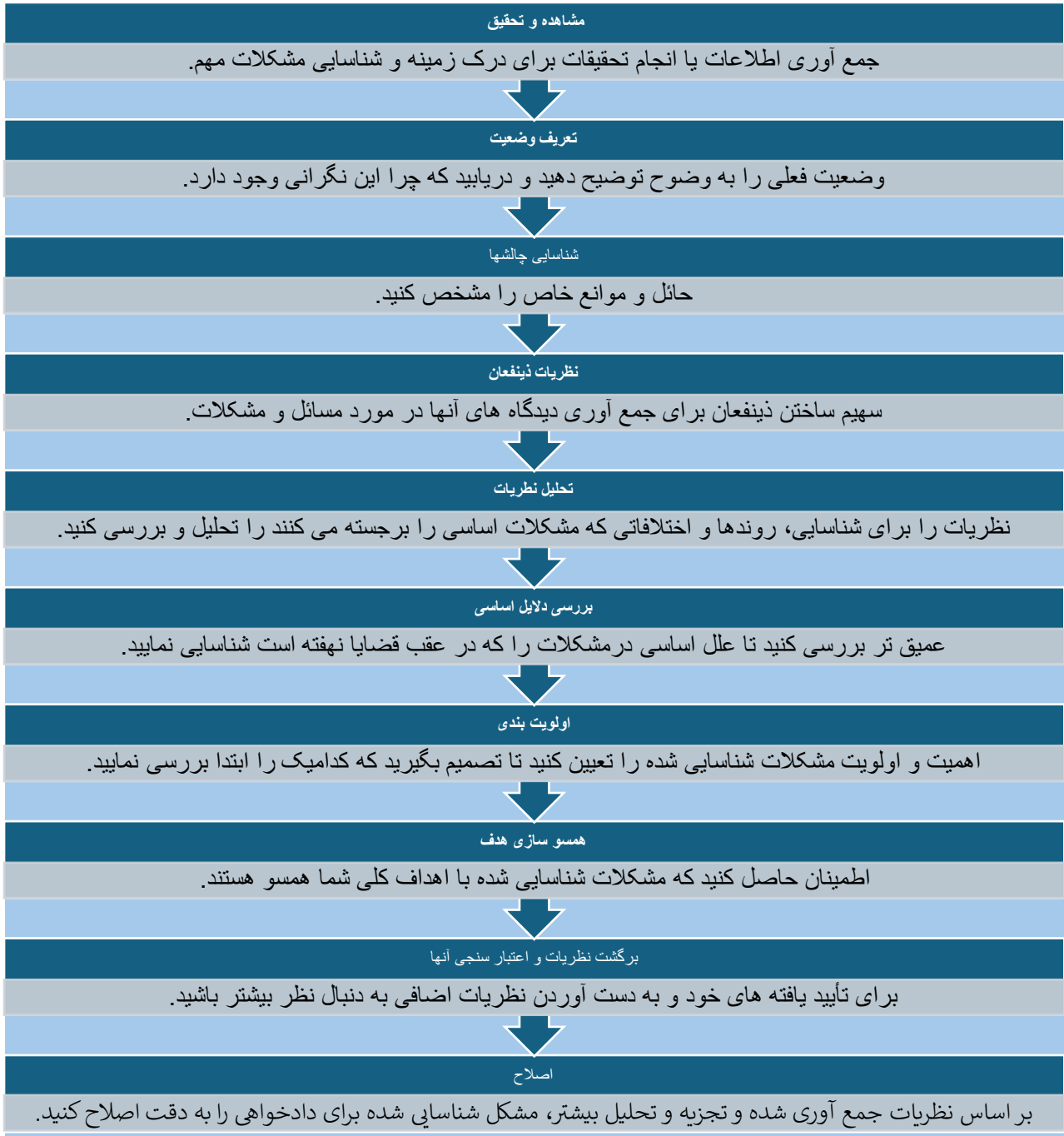
شکل ۲: روند شناسایی مشکل